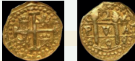
Monedas Macuquinas de Oro - Potosí

papel pues se daba el caso de que los orfebres custodiaban los metales preciosos y daban a cambio de este depósito un recibo en papel; poco a poco el uso de estos recibos se generalizó y los comerciantes en vez de retirar el oro de sus depósitos preferían intercambiar entre ellos los recibos.